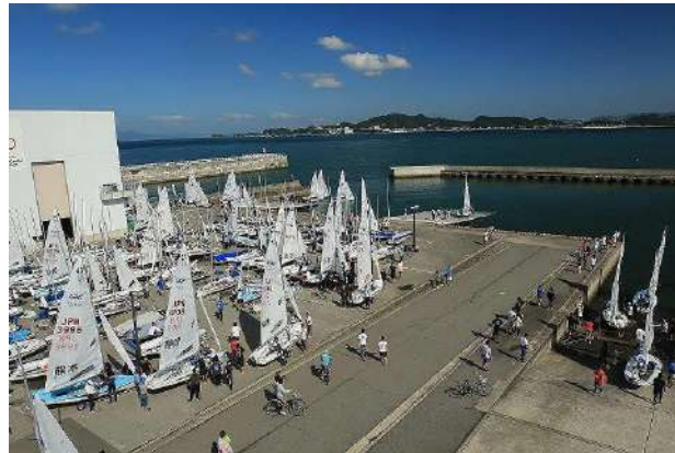
■和歌山セーリングセンター